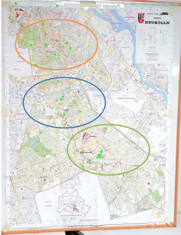
Abb. 3: Karte von Neukölln mit Verortung der AG Teilnehmenden

Teilnehmende finden sich in Kleingruppen zusammen, unterteilt in die Regionen Nord-Neukölln , Neuköllner Mitte und Süd Neukölln (siehe Abb. 3).